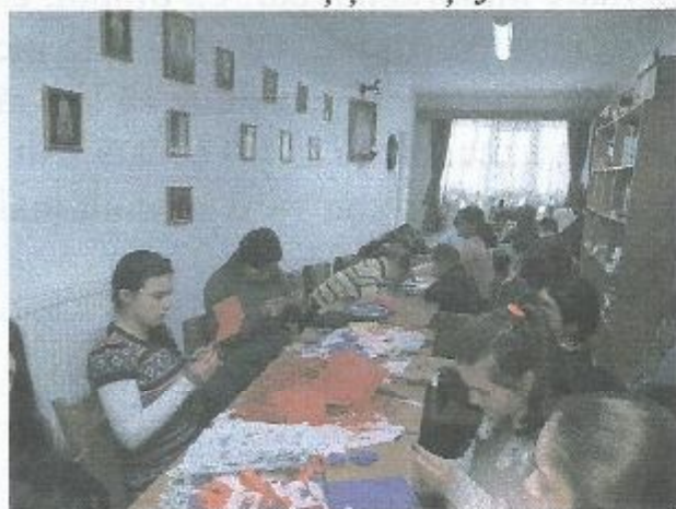
Lucrăm mărtișoare și felicitări